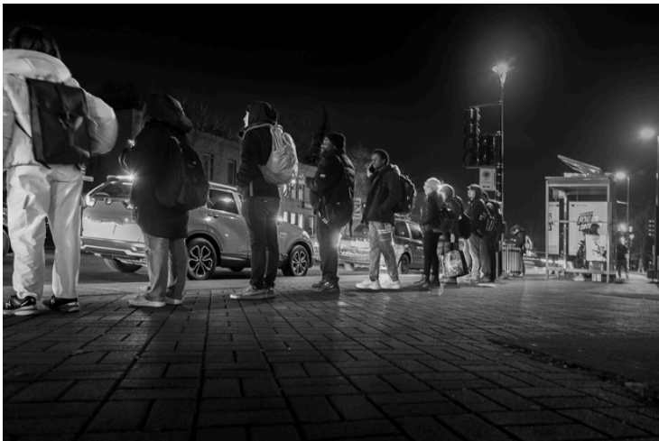
En ligne pour la 141 par ANDRÉ LEFRANÇOIS