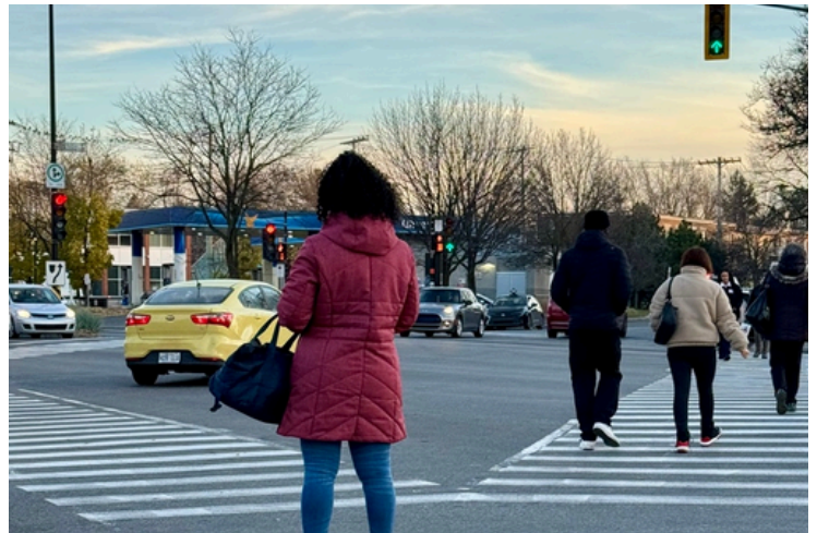
Chacun·e son tour par MARIE-JOSÉE PRÉNOVEAU